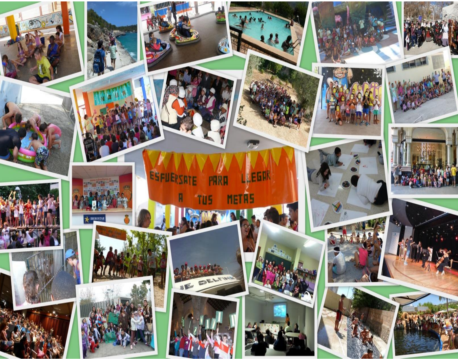
PROIECTE MARC 2016

NAÛM, PROIECTE SOCIO-EDUCATIVU Germanes de la Caritat de Sant Vicenç de Paül